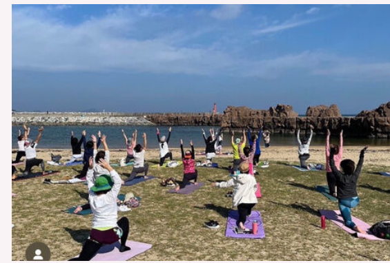
teamYOGA しんこきゅう ビーチヨガ 10:30~11:30