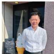
NOAM GARDEN 若松区本町3-8-19