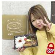
はしのしたBENTO 若松区本町1-2-25