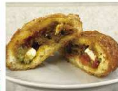
・スパイシーさ極めるっ! 旨辛カレーパン & more