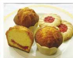
・若松水切りトマトジャムのカップケーキ ・若松水切りトマトジャムのワッキー