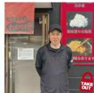
にくにく亭 二島店 若松区東二島1-1-2