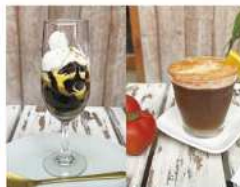
・トマトエスプレッソマルガリータ ・エッグコーヒゼリー