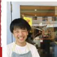
cafe ちいさなせかい 八幡西区鷹の巣2-14-25