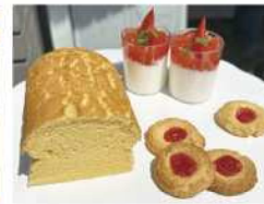
・若松トマトのミルクプリン ・ポフブルージュ & more...