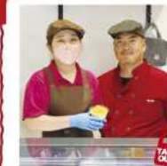
よつばジェラート 水巻町頃末南3-23-3