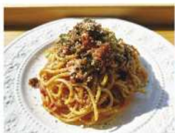
・若松トマトを使ったゴロゴロお肉の 贅沢ボロネーゼスパゲティ