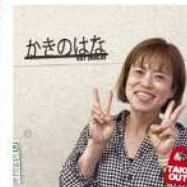
かきのはなカレーパン 若松区二島1-1