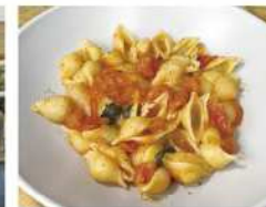
・フレッシュトマトのソース コンキリエ・リガーテ