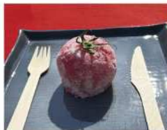
・若松トマトまるごと大福