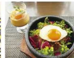
・ぐるませ味変ミルクセーキ ・旨み凝縮トマトドライカレー