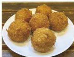
・若松トマトコロッケ「元気玉」