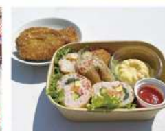
・若松トマトまいなりのSpringBox ・とまとDEギョロツケ