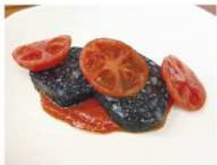
・甲イカソーセージ トマトソース & more...