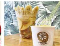
・黄色いプリンパフェ ・トマトソルベ