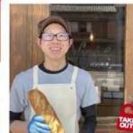
パンの小屋 vraie 八幡西区木屋瀬2-26-21