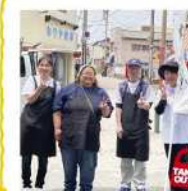
ひびき瀬漁業協同組合 若松区大字安屋1742