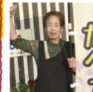
カレー&カフェ たべった 若松区大鳥居300