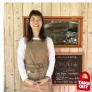
ohaNa coffee 若松区浜町2-2-9