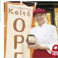
パティスリー ケイト 八幡西三ヶ森4-11-1