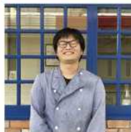
ぐらんとじゃるだん 若松区本町3-6-14