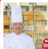
のだや 若松区二島6-1-6