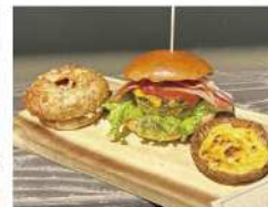
・エッグタルト・チーズトマトカレーパン ・スパニッシュコムレツサンド