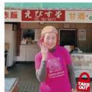
えびす堂 若松区中川町2-23