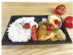
・若松トマトと卵を使った 愛情たっぷり息子2人の母弁当